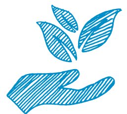
Diplome Universitaire Developpement Durable